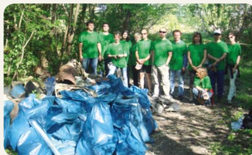
L'équipe slovaque a nettoyé une zone protégée située sur les bords du Danube dans laquelle se trouvent des vestiges de forêt primitive.

Ce programme, représenté par une mascotte nommée Gustino, est destiné aux utilisateurs de Ticket Restaurant® et Ticket Alimentacion®. Il a pour objectif d'aider le consommateur dans le choix d'une alimentation plus saine en l'informant sur les bonnes pratiques nutritionnelles, qu'il soit au restaurant ou qu'il achète des produits pour les cuisiner.