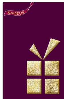
Un cadeau en or...