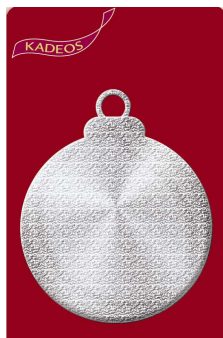
Cadeau qui scintille à Noël fait un joli présent